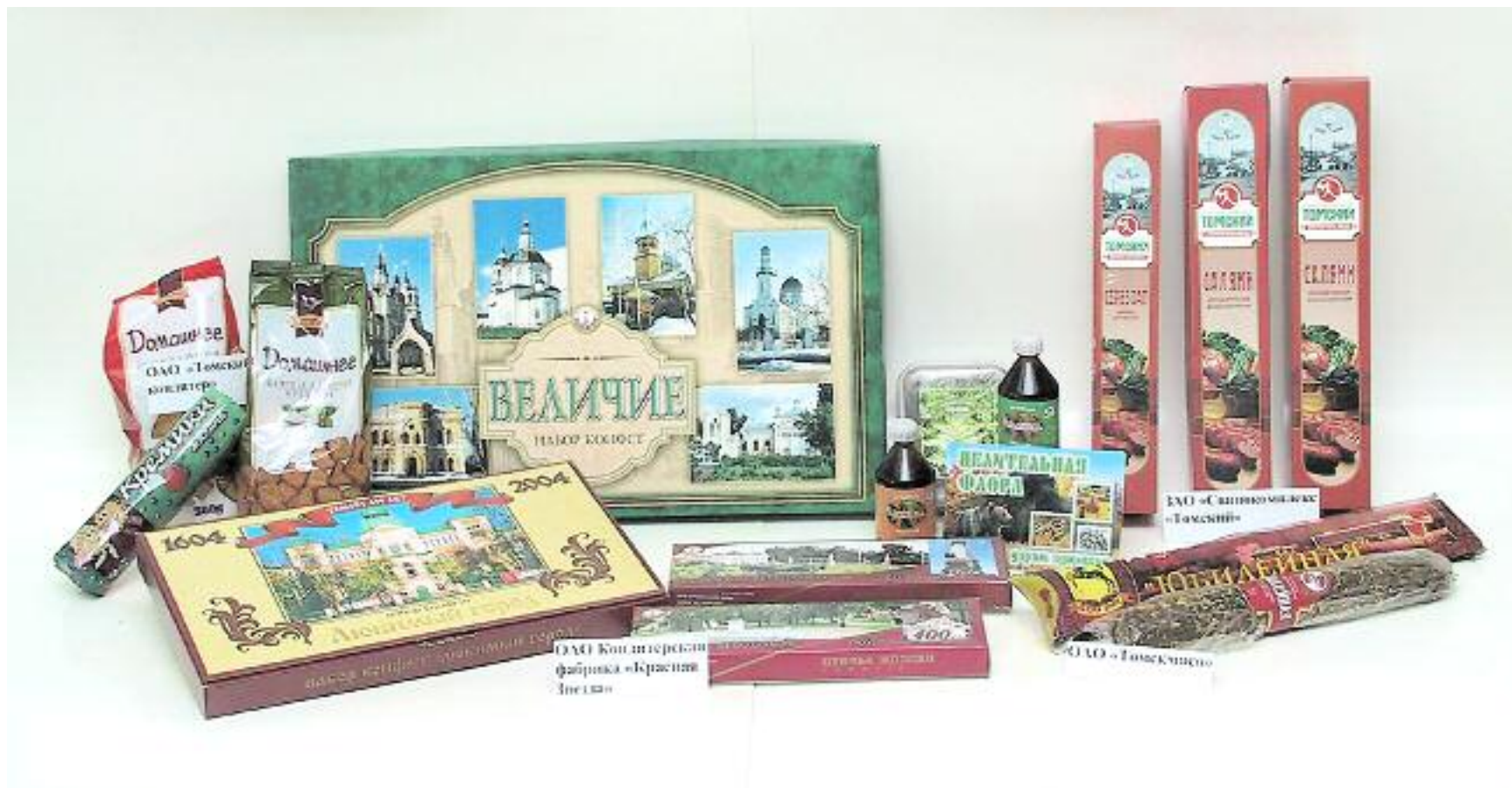
ОАО кондитерская фабрика "Красная Звезда" (наборы шоколадных конфет); ОАО "Томский кондитер" (печенье); ЗАО "Свинокомплекс "Томский" (колбасные изделия), ОАО "Томскмясо" (колбасные изделия); фирма "Флора-Т" (экстракты, концентраты из сибирских ягод)