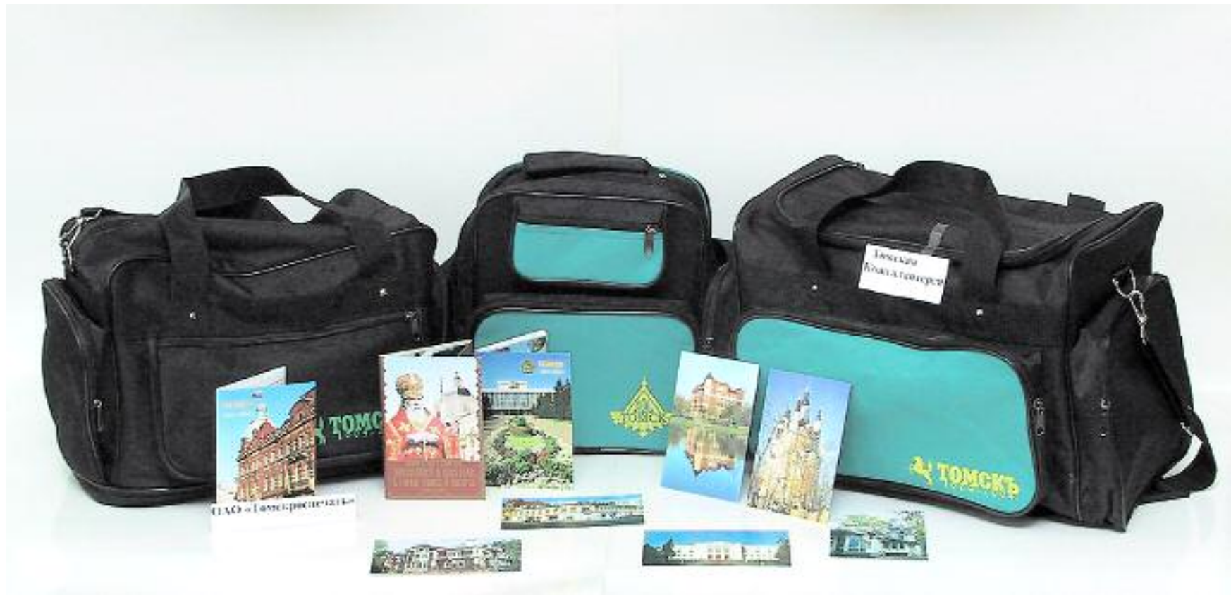
ЗАО "Томская кожгалантерея" ( сумки дорожно-спортивные с юбилейной символикой); ОАО "Томкроспечать" (наборы фотографий)