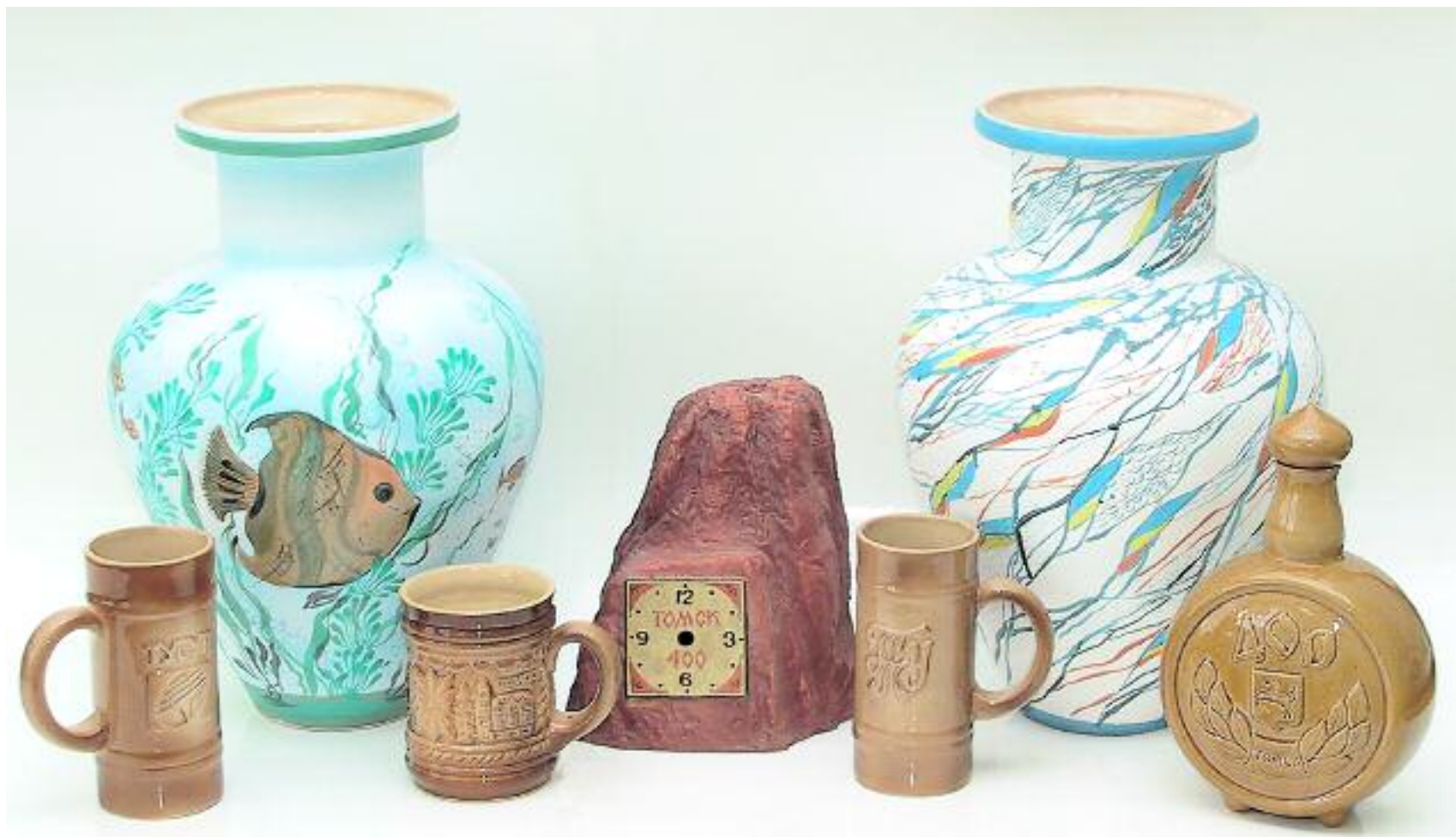
ЗАО "Томский завод керамических материалов и изделий" Ваза "Фантазия", кружка "Университеты г.Томска", кружка "Томск", камень "Часы".