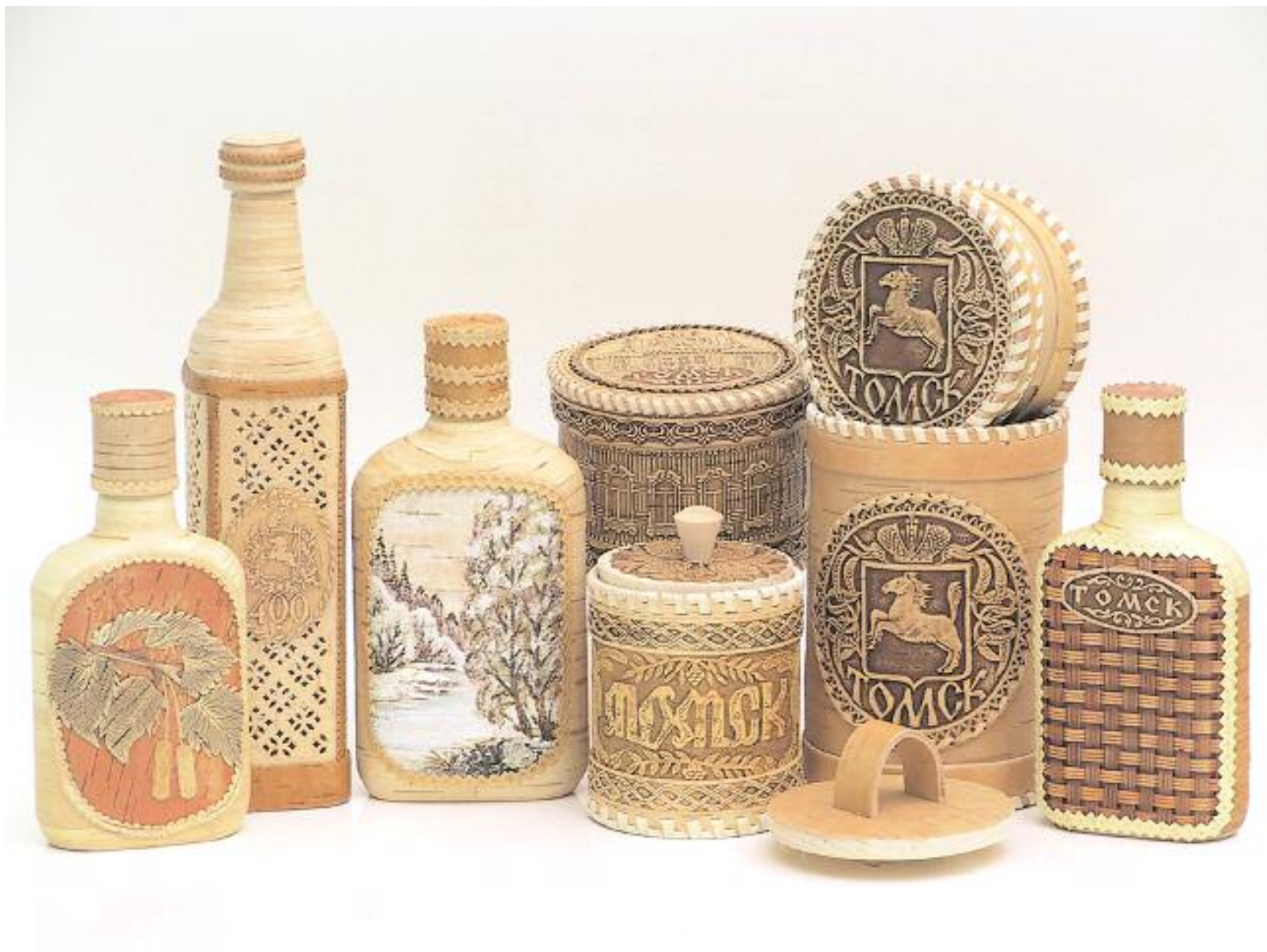
ООО "Томские узоры", г.Томск Изделия из бересты: бутылки в бересте, туеса, шкатулки