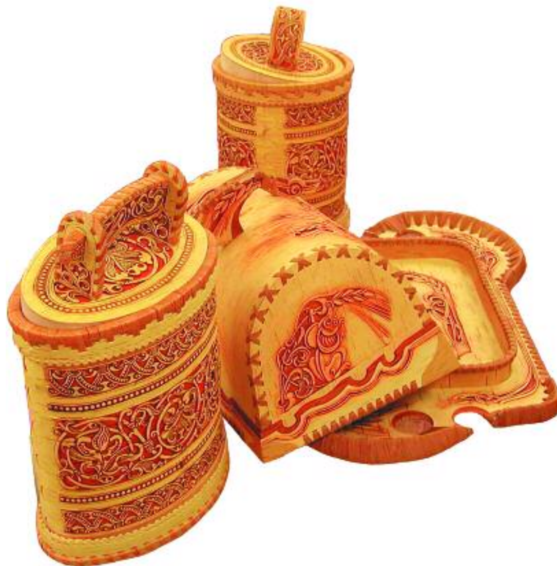
Музей истории Томска (Лавка Томского купца) Изделия из бересты: туеса, хлебница