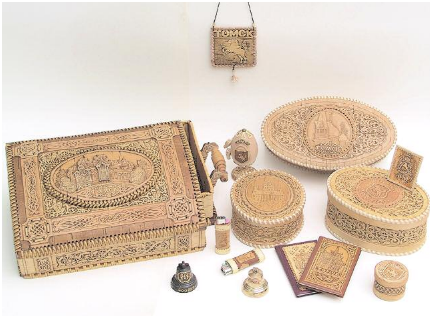
ООО "Томские узоры", г. Томск Шкатулки, туса из берест, записные книжки, значки, зажигалки, колокольчик