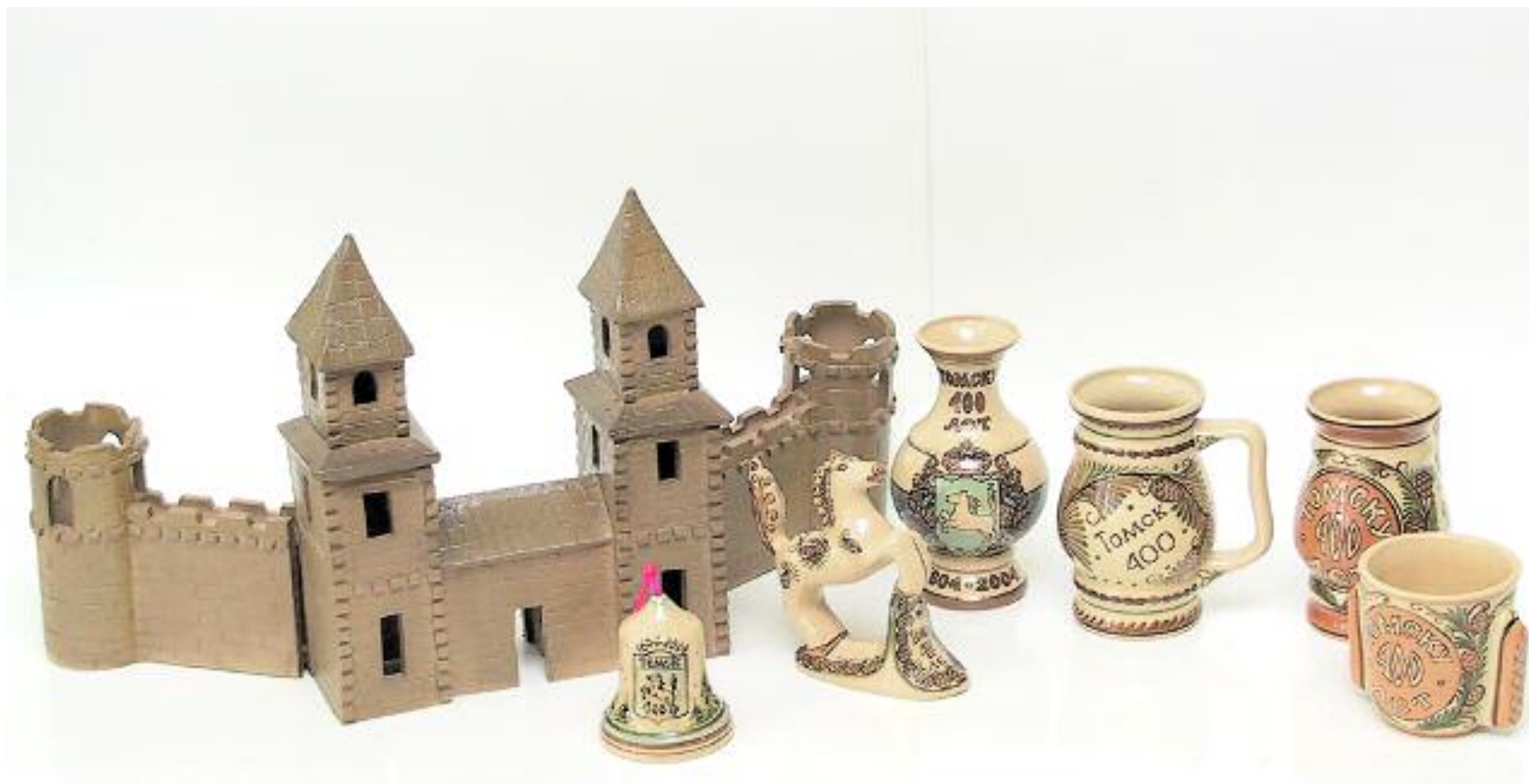
ЗАО "Томский завод керамических материалов и изделий" Сувенир "Замок", кружки, вазы, колокольчик, лошадка "Гербовая"