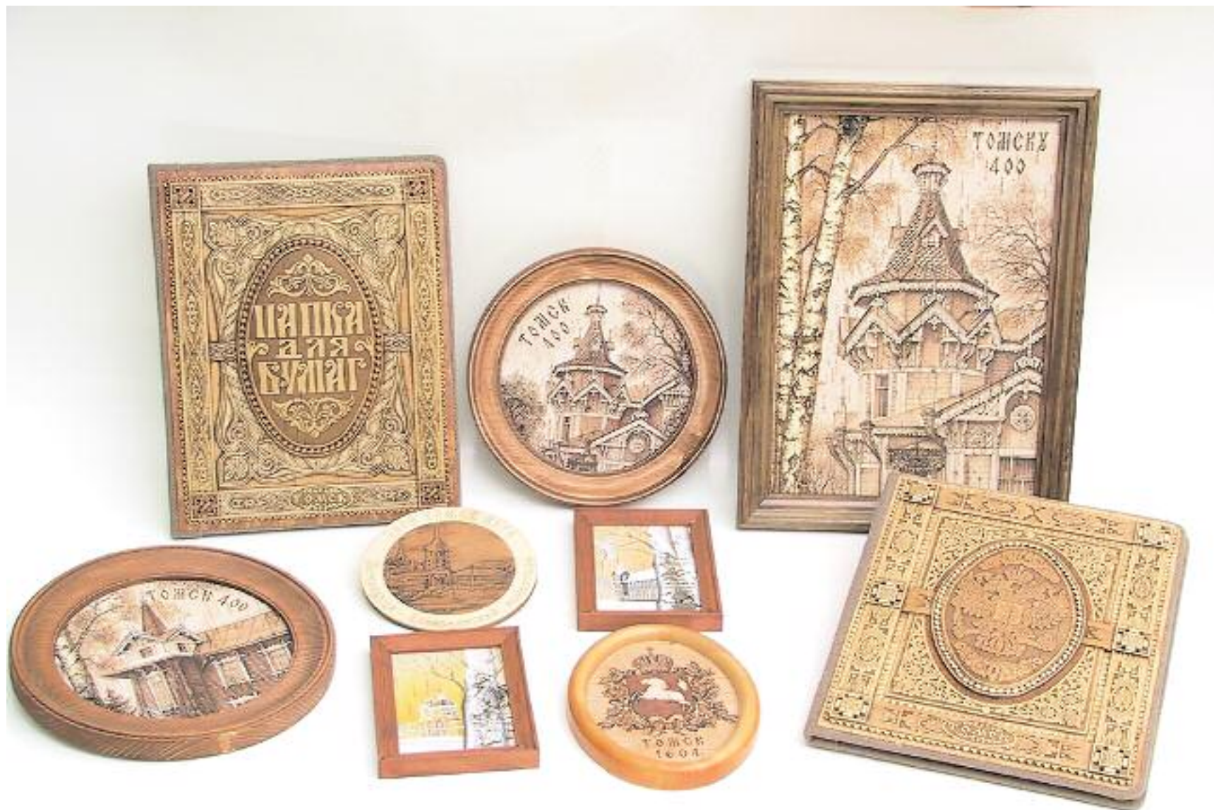
ООО "Томские узоры", г. Томск Изделия из бересты: папки для бумаг, картины, панно