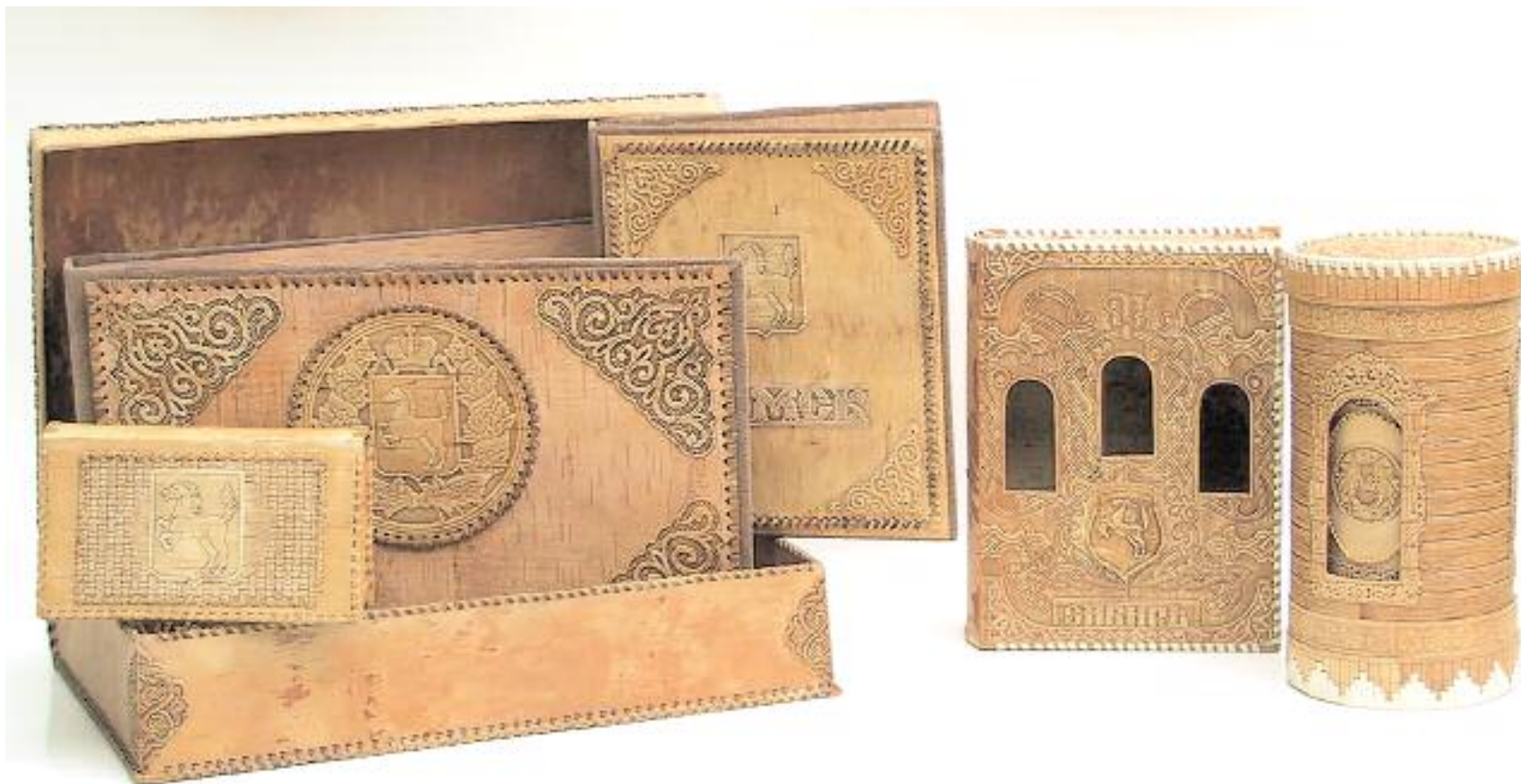
ООО "Богара", г. Томск Изделия из бересты: набор "Томск- 400", туеса