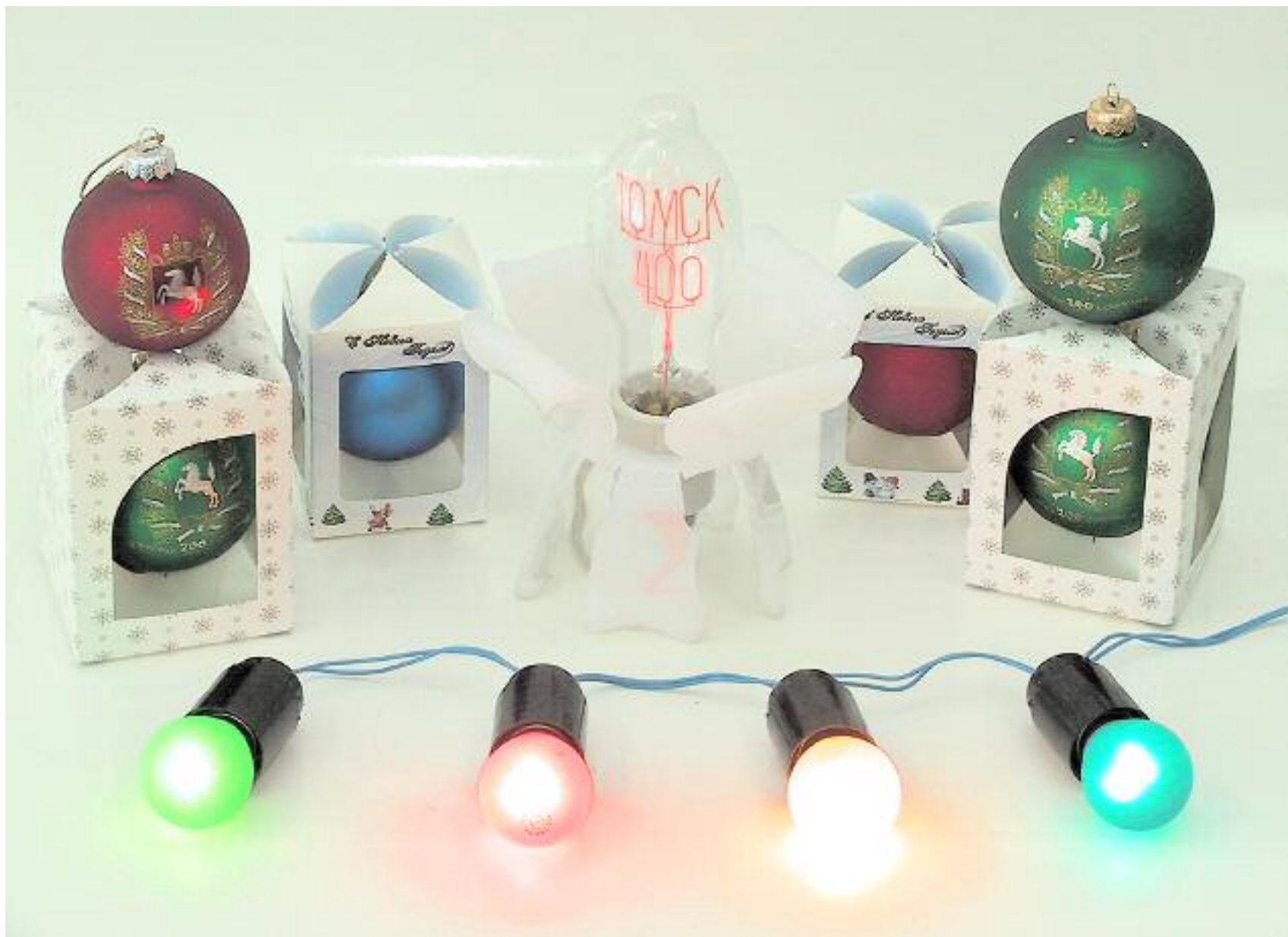
ЗАО "Томский электроламповый завод" Неоновые лампы, подставки, елочные шары