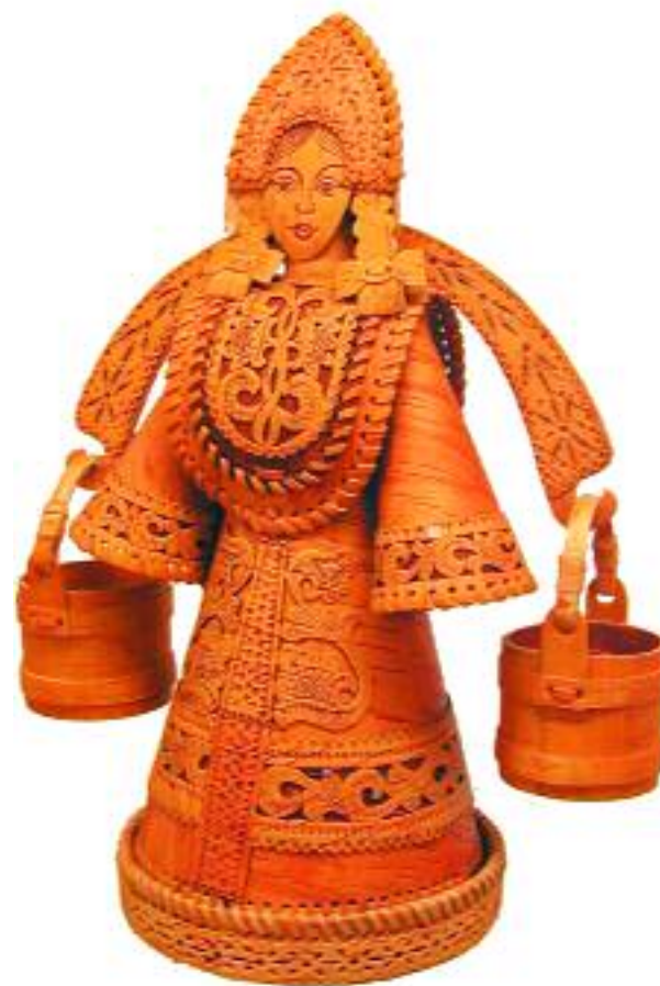
Музей истории Томска (Лавка Томского купца) Изделия из бересты и дерева: "Сибирский воин", "Томская красавица"