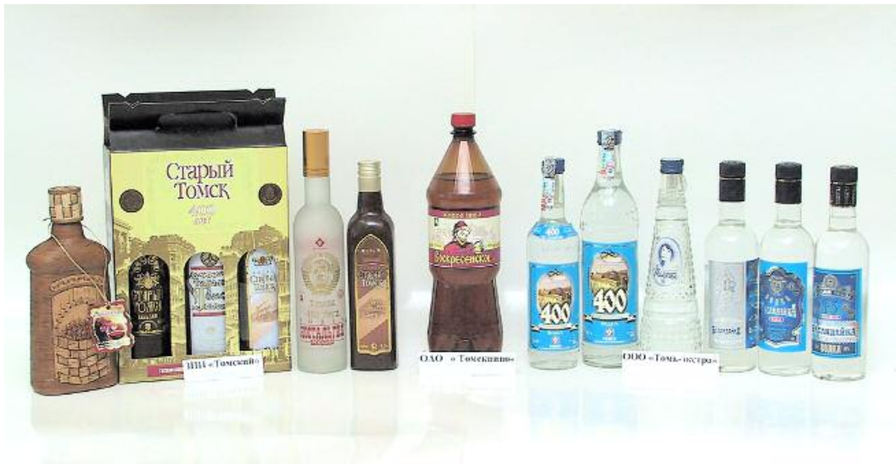
ФГУП ЗПП "Томский", ООО "Томь-экстра", ОАО "Томское пиво" Слабоалкогольные напитки, вино-водочные изделия